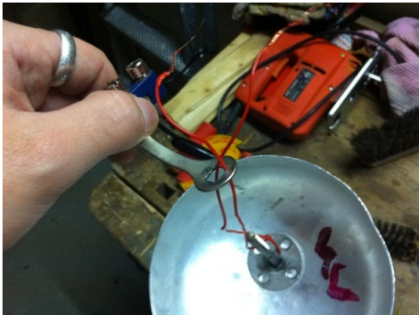
Abb. 8 Litze durch Glockenstecker