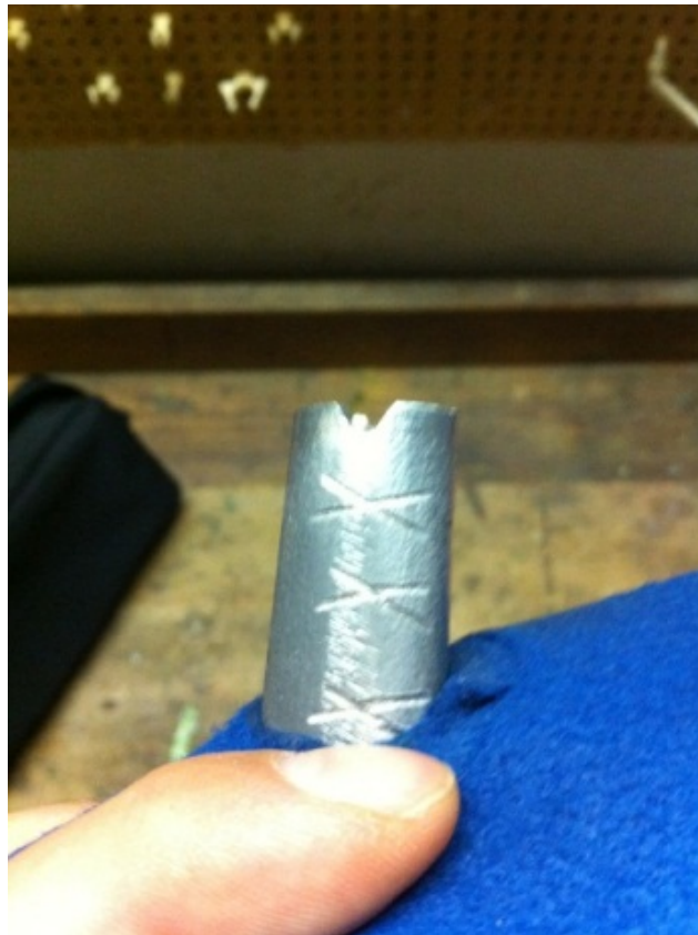
Abb. 12 Rille am Griff