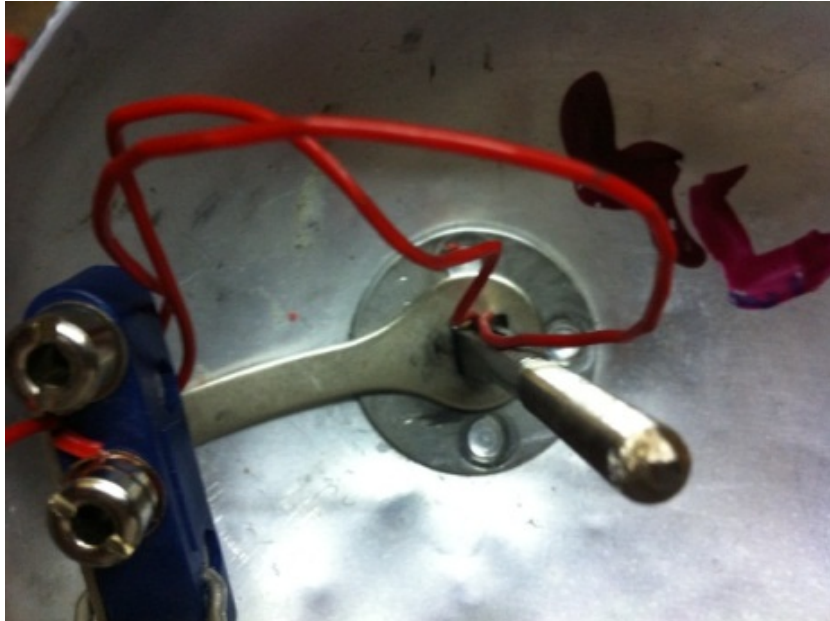
Abb. 9 Litze an Stecker