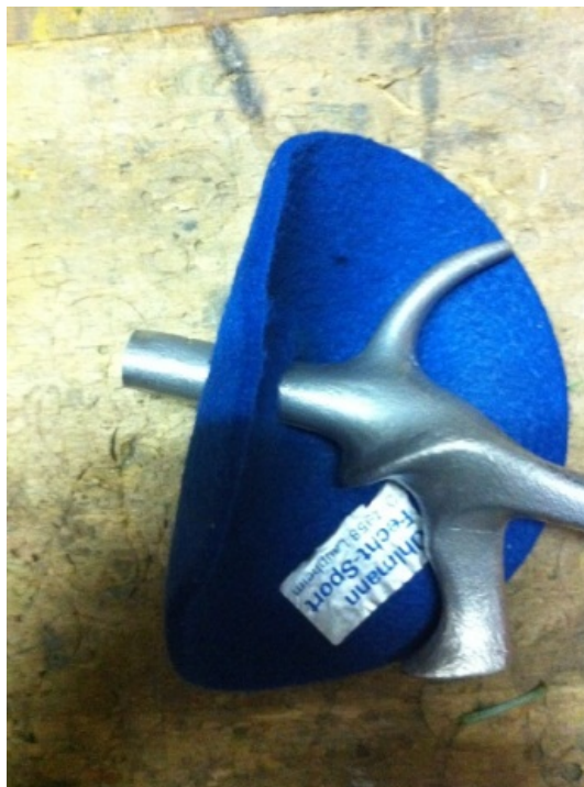
Abb. 10 Glockenpolster