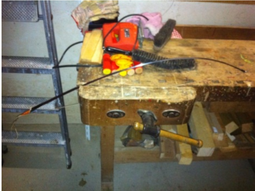
Abb. 5 Eingespannte Klinge