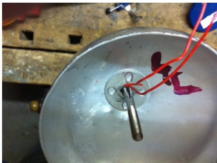
Abb. 7 Isolierschlauch und Glocke