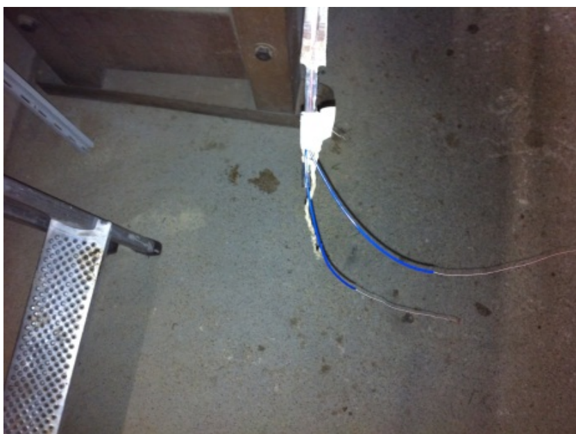
Abb 4 Klingenende