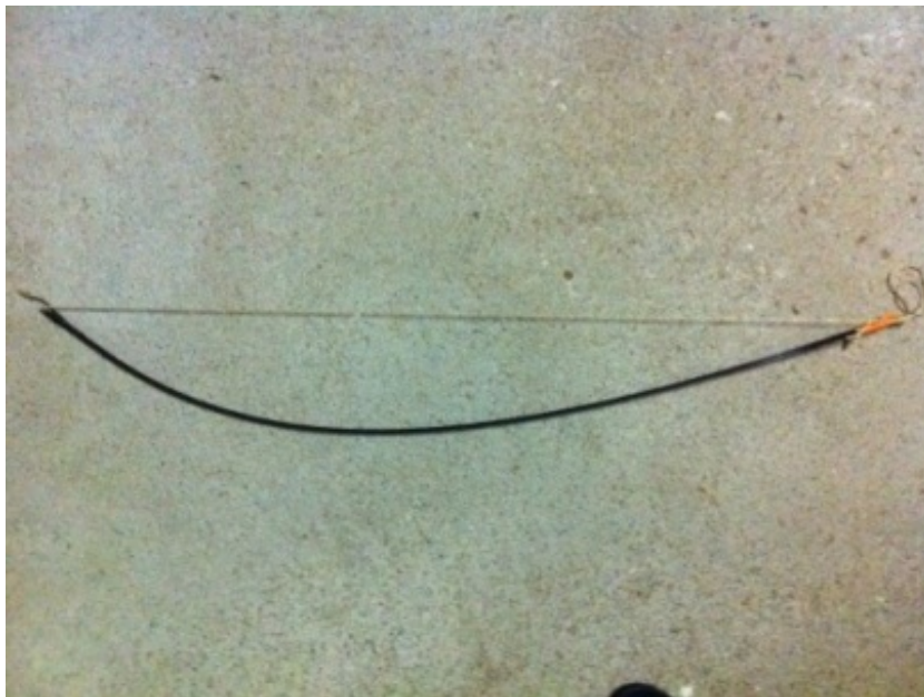
Abb. 2 Klingenziegung