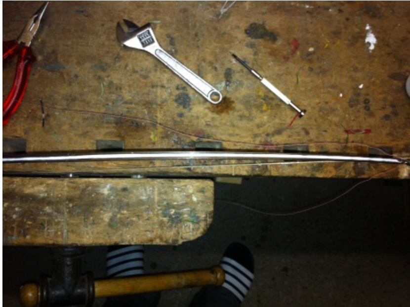
Abb. 3 Leim in Rille