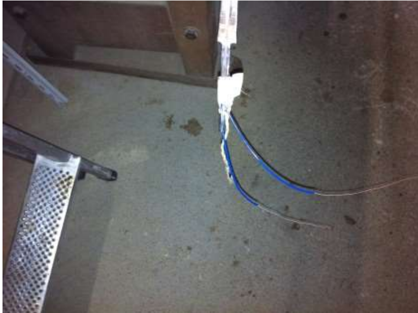
Abb 4 Klingenende