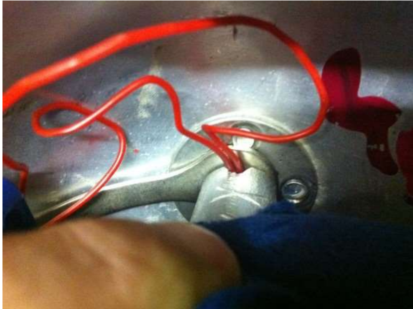
Abb. 11 Litze nicht abdrücken