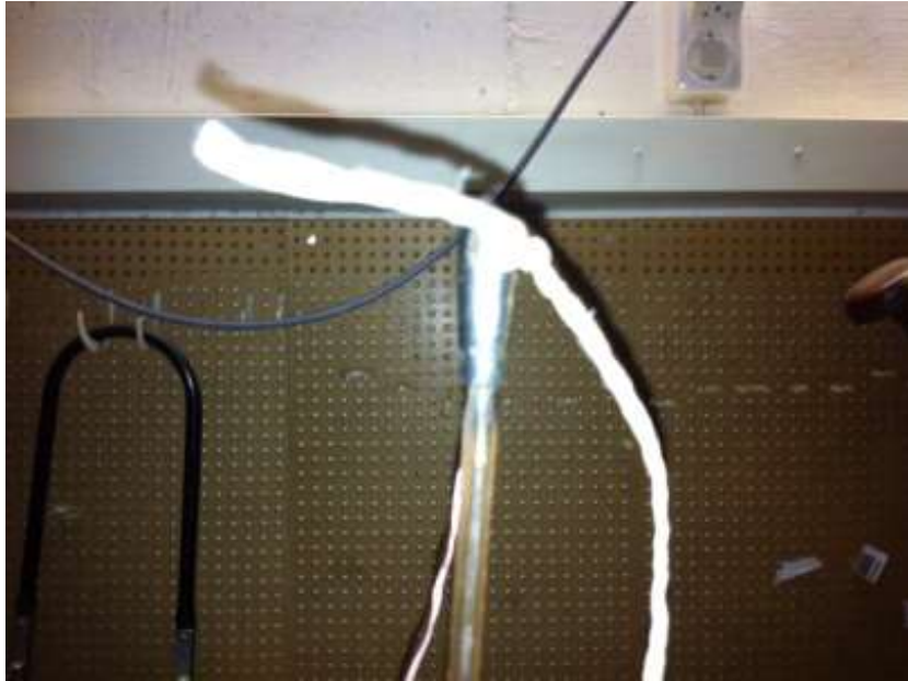
Abb. 1 Schnur durch Spitzenlöcher