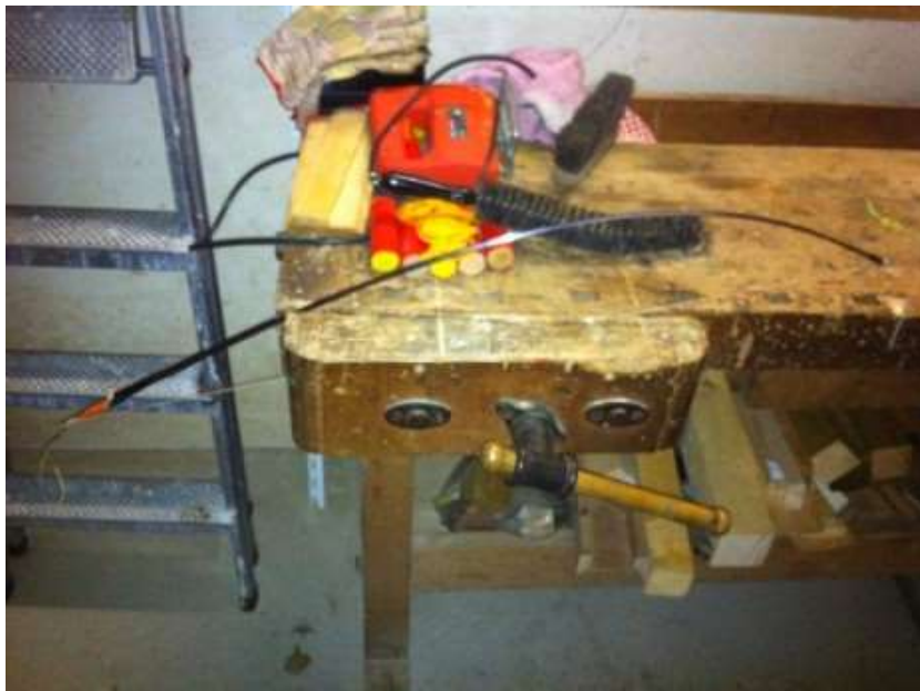
Abb. 5 Eingespannte Klinge