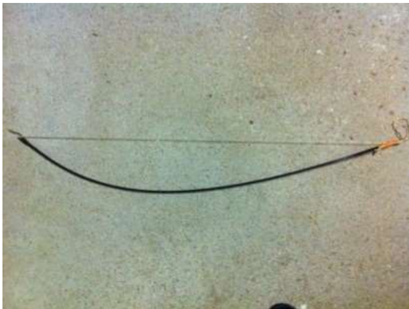
Abb. 2 Klingenbiegung