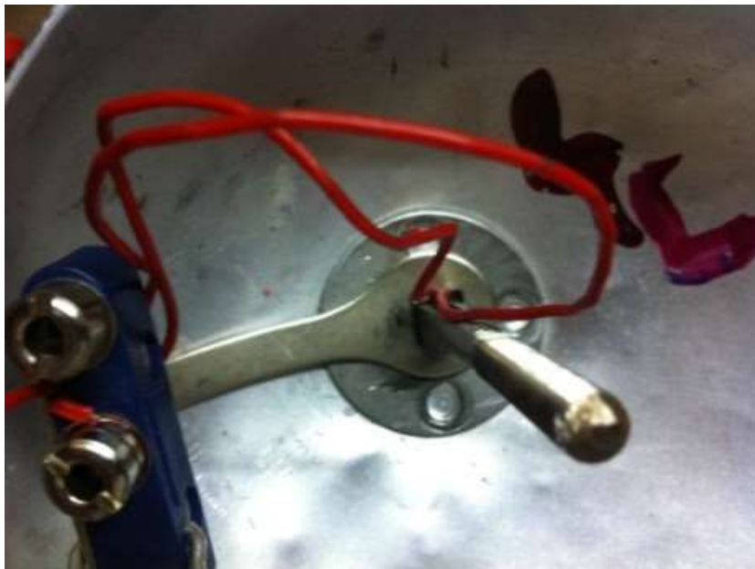
Abb. 9 Litze an Stecker