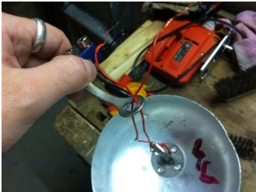
Abb. 8 Litze durch Glockenstecker