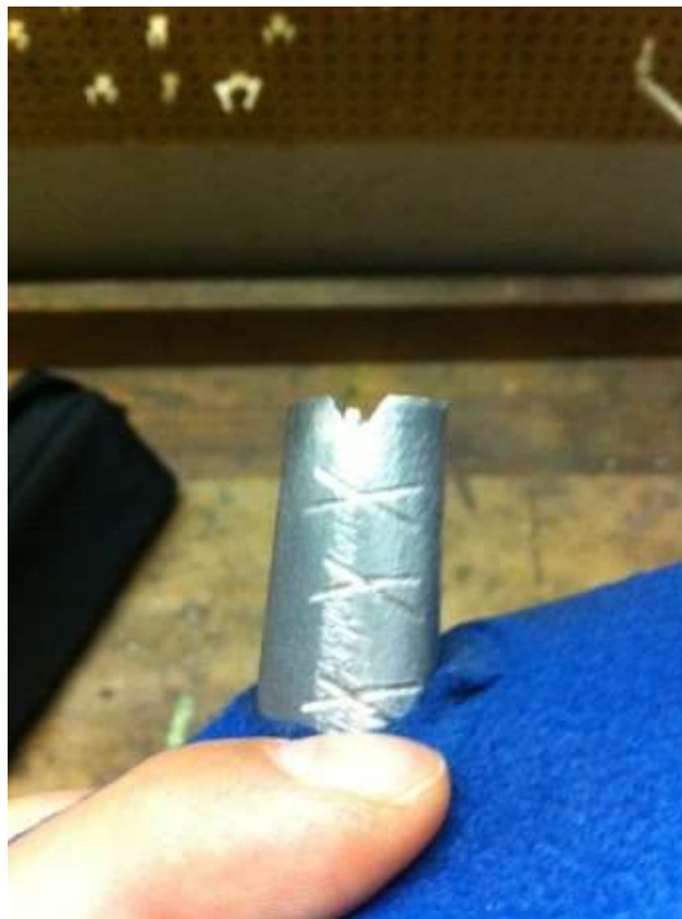
Abb. 12 Rille am Griff