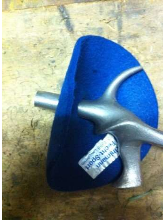
Abb. 10 Glockenpolster