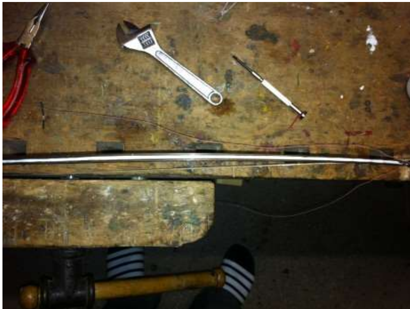
Abb. 3 Leim in Rille