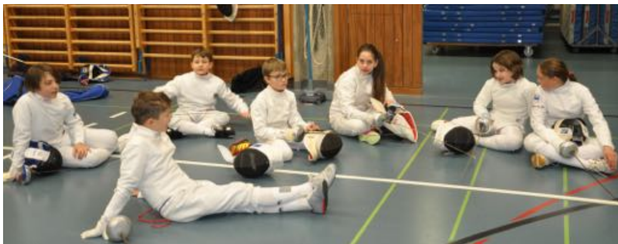
Wann geht es endlich weiter?