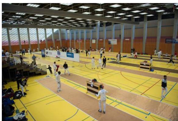
Impression der Schweizermeisterschaften 2015 in Zug

Wir erwarten von unseren Mitgliedern, sich mit den Regeln des Fechtsports vertraut zu machen. Als Folge dessen können wir an externen Turnieren immer genügend Schiedsrichter stellen und unseren Verpflichtungen nachkommen.