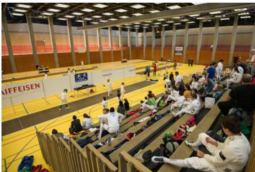
Impression der Schweizermeisterschaften 2015 in Zug

Bei einem vom Zuger Fechtclub organisierten Turnier erwartet der Vorstand, dass alle Mitglieder des Vereins mithelfen.