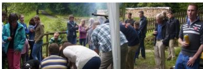
Grillieren am Sommerfest 2015