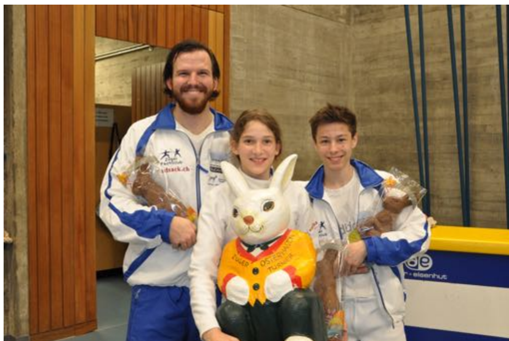
Stolze Gewinner des Osterhasenturniers 2015