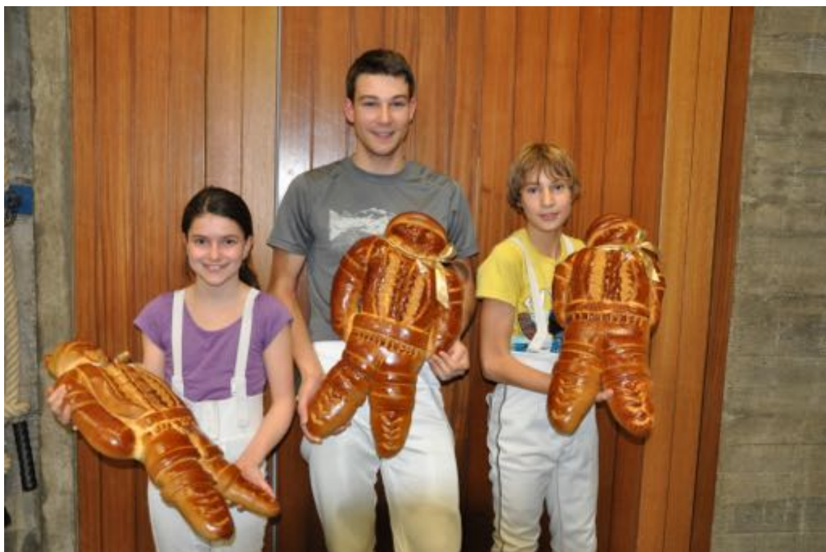
Stolze Gewinner des Clauturniers 2015