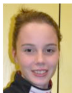
Vereinstrainerin und Trainervertretung im Vorstand