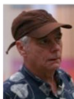
Material-Service für Clubanlagen