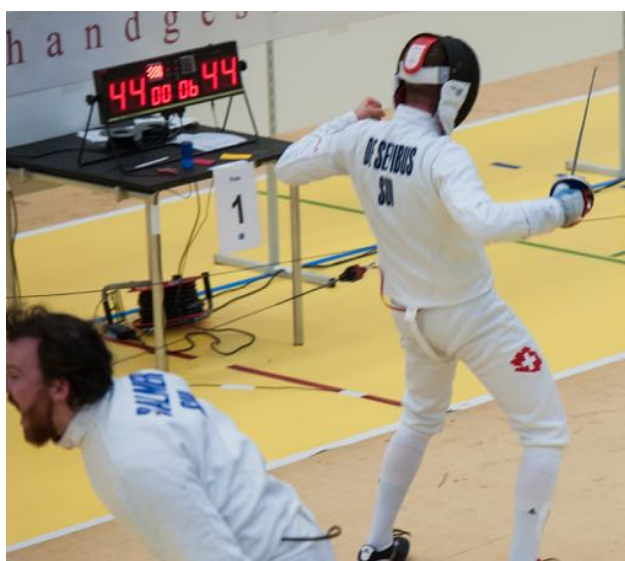
Grosse Freude über den Aufstieg!

jugendundsport.ch Viele News über Fecht-J&S-Kurse