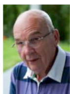
Material-Service für Club- Waffen