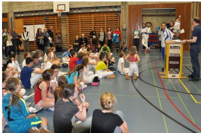
Preisverteilung am Chlausturnier 2015

Die Preisverteilung für die Juniorenkategorien findet immer am Sommeranlass des Zuger Fechtclubs statt, die der Senioren immer an der Generalversammlung des Zuger Fechtclubs.