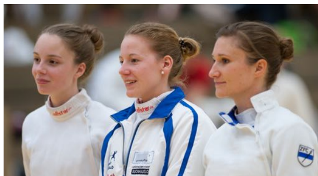
Das Damen-Team anlässlich der SM 2015 in Zug

Der Vorstand wünscht Solange einen guten Start in ihrem neuen Amt!