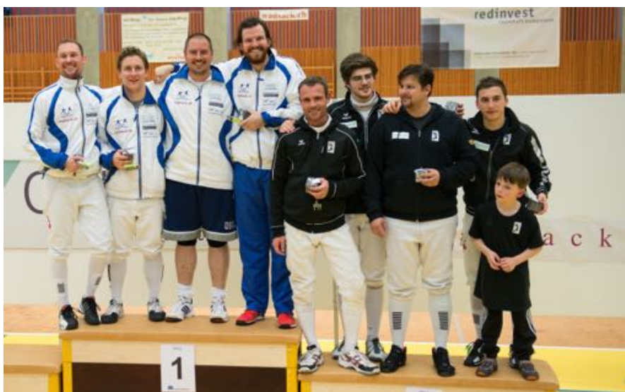
Das Herren-Team an der SM 2015 in Zug