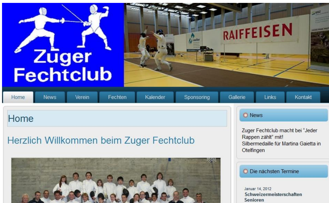
Screenshot unserer Startseite: www.zugerfechtclub.ch

Auf unserer Homepage findet Ihr viele aktuelle und weiterführende Informationen sowohl über den Trainingsbetrieb, wie auch über aktuelle News. Der Vorstand und das Trainerteam des Zuger Fechtclubs wollen zukünftig vermehrt Informationen über unsere Website veröffentlichen.