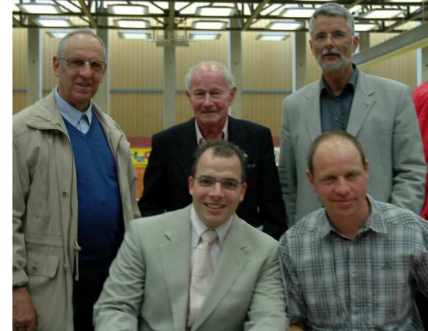
Alle ehemaligen Präsidenten des Zuger Fechtclubs

Der Zuger Fechtclub wurde 1951 gegründet und hat sich im Laufe der letzten 60 Jahre zu einem modernen Verein entwickelt. Mittlerweile umfasst dieser rund 80 Mitglieder, wovon rund zwei Drittel Juniorinnen und Junioren unter 20 Jahren sind. Einen idealen Einstieg zum Fechtsport wird beim Zuger Fechtclub durch den Schulsport in der Primarschule ermöglicht. Auch später Interessierten bieten Anfängerkurse noch die Gelegenheit, mit dem Fechten zu beginnen. Im Vergleich zu den Schweizer Hochburgen (Basel, Bern, Genf, Zürich) sind die Trainingsmöglichkeiten in Zug relativ begrenzt. Im Gegensatz zu anderen Vereinen, die eigene Fechtsäle und vollengagierte Trainer besitzen, bestreiten wir unser Training