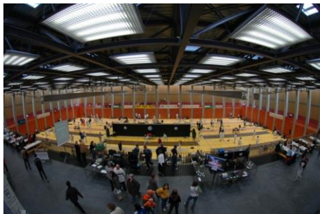
Schweizermeisterschaften der Senioren 2005 in Zug

Schweizermeisterschaft / Championnats Suisses, 3./4. Juni 2017 in Zug